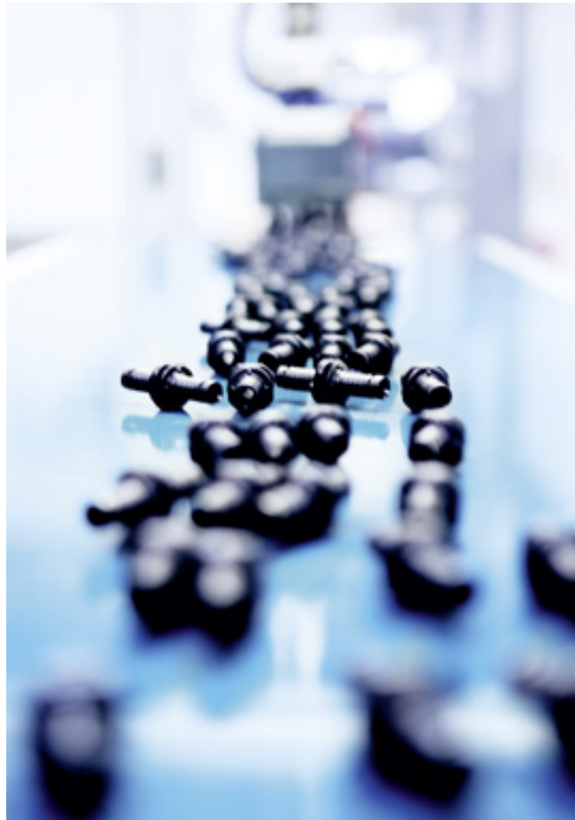
Производство фитингов и металлополимерной многослойной трубы TECElogo.