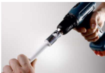
...калибруем, снимаем фаску...