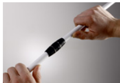
...соединяем трубу и фитинг.