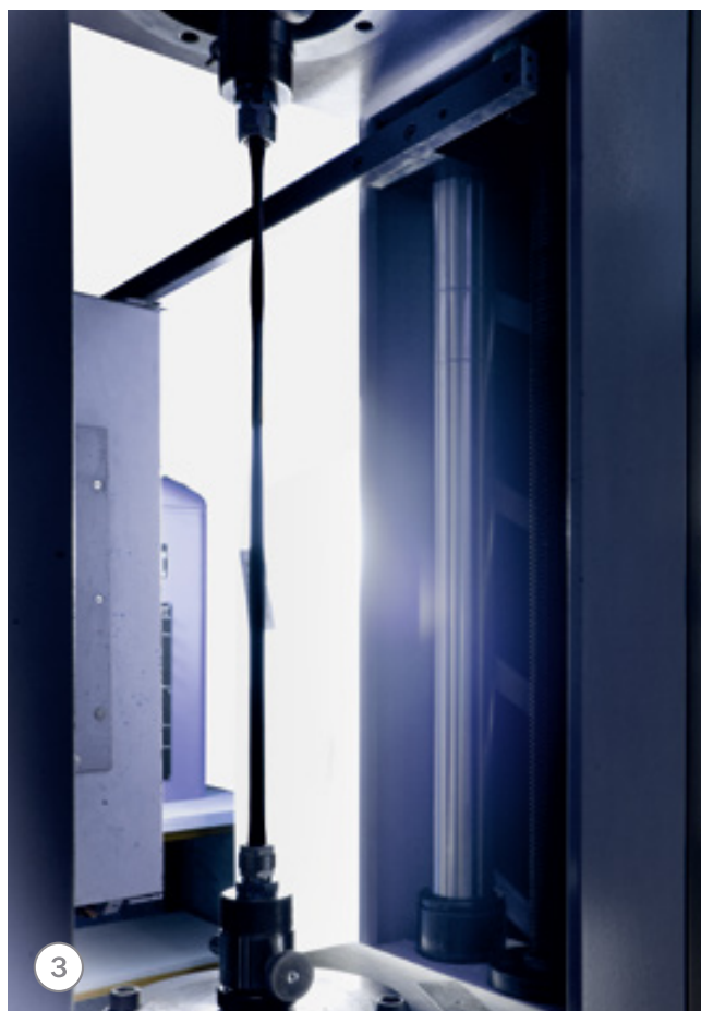
(1) Установка для проверки прочности соединения труб, (2) 3D сканер для проверки фитингов TECElogo, (3) Испытание трубы TECElogo на растяжение.

В целях обеспечения высокого качества продукции исследовательским центром TECE постоянно осуществляется контроль качества системы TECElogo посредством тестов и испытаний.