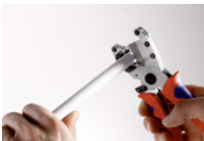
Обрезаем трубу при помощи труборезных ножниц...

Соединение производится без использования запрессовочного инструмента. Для обработки используются только ножницы для резки труб и калибратор. Обработанная этими инструментами труба просто и легко вставляется в фитинг.